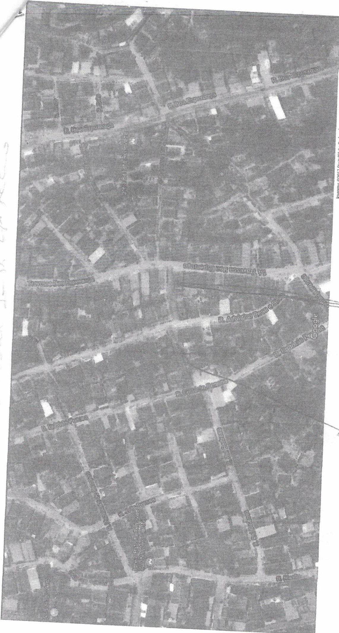
Imagem ©2017 DigitalGlobe, Dados do mapa ©2017 Google Brasil 20 m